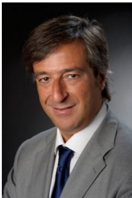
Dott. Nino Cartabellotta

“Per la prima volta da fine giugno diminuiscono i nuovi casi settimanali - dichiara Nino Cartabellotta, Presidente della Fondazione GIMBE - sia come numeri assoluti che come media mobile dei casi giornalieri che si attesta a 5.644”.