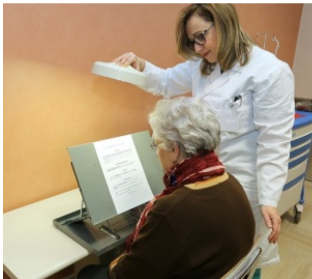
Leggio per ipovisione

A questa prima fase seguirà la prescrizione dell'ausilio e quindi la riabilitazione, cioè il training per utilizzare al massimo il residuo visivo, gli esercizi per usare l'ausilio e quelli per acquisire nuove strategie per l'autonomia.